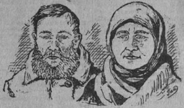
7-го марта в отряде рай-населения, а единичным хо-