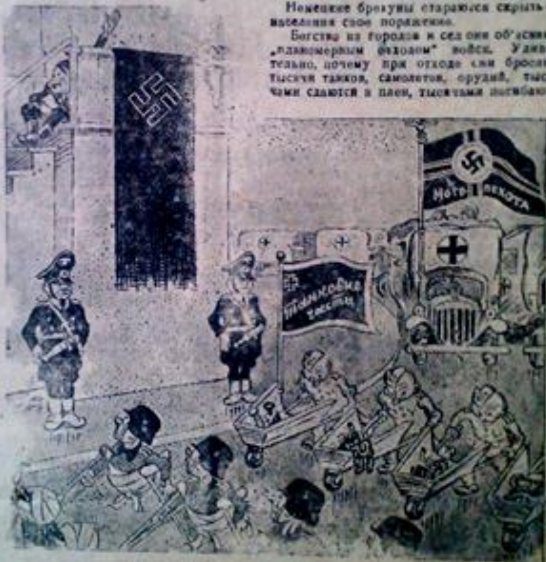
Сюжет дивизий, совершивших „плановый отход“

Бегство из городов и сел они объясняют „плановым отходом“ войск. Удивительно, почему при отходе они бросают тысячи танков, самолетов, орудий, тысячами сдаются в плен, тысячами погибают!