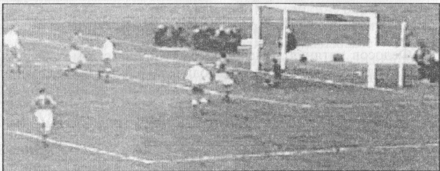
Нападающий сборной СССР Генрих Федосов (№ 9) забивает второй мяч в ворота поляков

Поляки, увидев, что в нападении сборной СССР нет четырех основных игроков, главной ударной силой посчитали Стрельцова и сразу начали опекать его, причем настолько плотно, что он уже на 5-й минуте получил серьезную травму. Замены тогда не разрешались. Помощь пострадавшему пришлось оказывать у кромки поля, поэтому какое-то время команда играла вдесятером. Стрельцов понимал, что в случае своей неудачной игры, да еще, не дай бог, при поражении, его ждет суровое наказание за опоздание к поезду Москва — Берлин. Поэтому он, вернувшись на поле, стиснув зубы, играл как никогда напористо. И, несмотря на травму, на 31-й минуте открыл счет. А на 75-й минуте атаку с участием Стрельцова завершил Федосов. Контрнаступления польской команды не имели в тот день успеха — блистательно стоял Яшин, который спас в первые полчаса от двух-трех голов. Еще дважды поляки промахивались мимо пустых ворот.