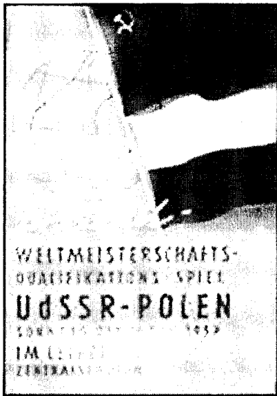
Так выглядела обложка программки к матчу СССР—Польша, выпущенной в Лейпциге

Матч СССР — Польша, состоявшийся 24 ноября 1957 года в Лейпциге, вообще можно смело отнести к одному из самых памятных игр нашей сборной. И не только потому, что тогда решался вопрос, будет ли она участвовать в первом для себя чемпионате мира.